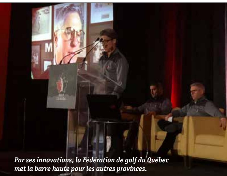
Par ses innovations, la Fédération de golf du Québec met la barre haute pour les autres provinces.

Avec plus 700 écoles inscrites au programme de Golf en milieu scolaire, 36 événements du Circuit Premier départ, 12 structures du Golf-études et 8 athlètes au sein de l'équipe nationale, l'équipe de Golf Québec a émerveillé ses acolytes des autres provinces en regard à ses initiatives d'initiation au golf et de développement des athlètes.