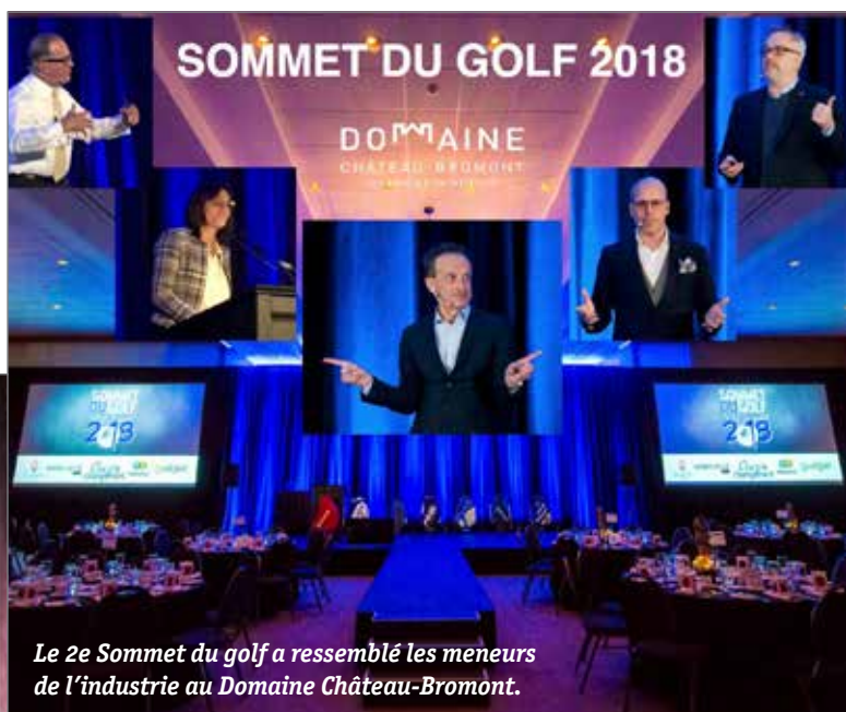
Le 2e Sommet du golf a rassemblé les meneurs de l'industrie au Domaine Château-Bromont.

Afin de bien refléter l'ampleur de ses accomplissements, Golf Québec a souligné la réussite de la campagne de collecte de fonds «De l'école au club de golf» qui a permis d'amasser près de 800 000$ en 12 ans. La campagne Sortez, golfez a bien évidemment capté l'attention des gens par son contenu et sa différence. Nulle part au Canada une telle campagne n'a pris son envol afin de faire croître la pratique du golf auprès des golfeurs publics et récréatifs.