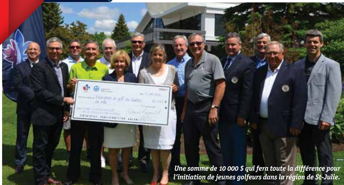
Une somme de 10 000 $ qui fera toute la différence pour l'initiation de jeunes golfeurs dans la région de St-Julie.