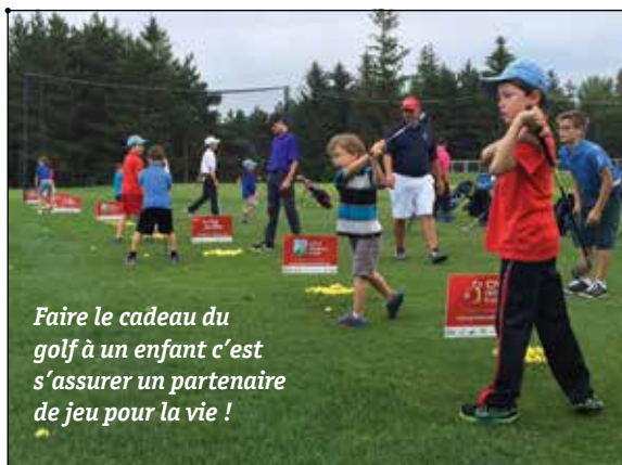
Faire le cadeau du golf à un enfant c'est s'assurer un partenaire de jeu pour la vie !

La saison dernière s'est révélée remarquable. Une publicité de 30 secondes faisant la promotion du jeu auprès d'une clientèle jeunesse a été diffusée sur plusieurs chaînes de télévision. Notre campagne de collecte de fonds, dont le Tournoi-bénéfice, a permis d'amasser plus de 100 000 $ destinés à soutenir nos programmes. Plus du tiers du budget annuel a été investi dans l'initiation et la récréation.