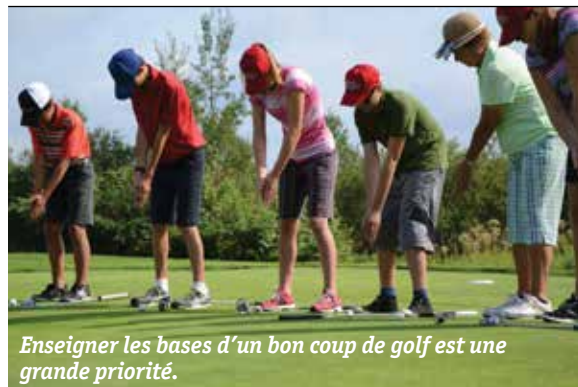
Enseigner les bases d'un bon coup de golf est une grande priorité.