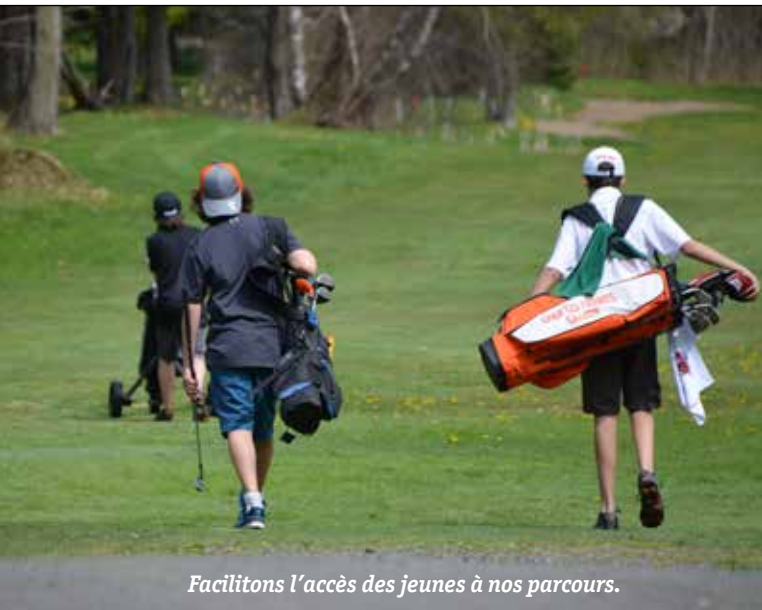
Facilitons l'accès des jeunes à nos parcours.

Golf Québec fait du développement de la relève une de ses principales priorités en assurant la pérennité de l'industrie du golf à travers son volet « Développement du sport ». Premier départ vient agrémenter nos programmes juniors tels que les Premiers élans commandité par Acura, Golf en milieu scolaire, la Golfmobile et les Centres de développement de golf junior.